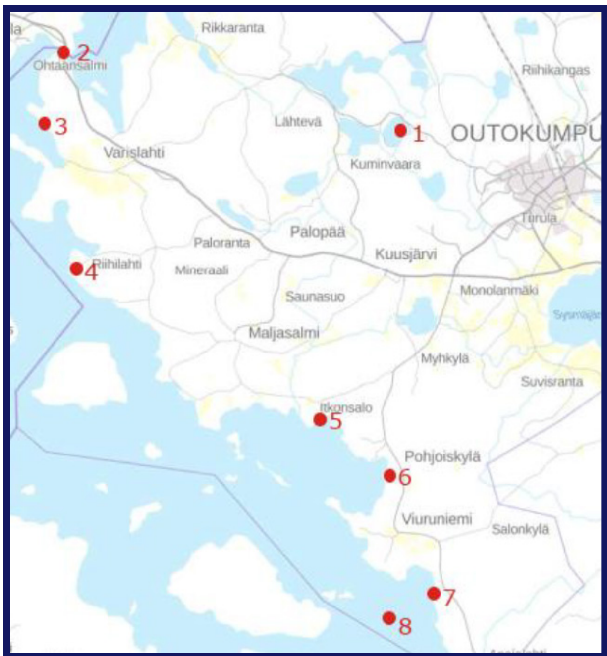
Juojärven osayleiskaavan muutoksen ja Särkiselän osayleiskaavan alueet.

Osayleiskaavalla tutkitaan alueen kaavoituksen ajantasaisuus ja mahdollisuudet sijoittaa omarantaisia tontteja Juojärven ja Särkiselän rannoille. Kaavaluonnos on valmistunut ja kaavaedotus on tarkoitus saattaa valtuuston hyväksyttäväksi kevään 2023 aikana.